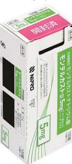
③ ミシン目に沿って切り取る