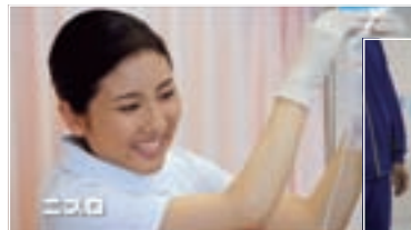
新・想いは一緒 篇