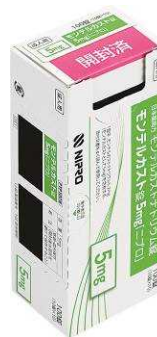
③ ミシン目に沿って切り取る